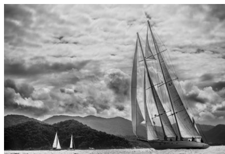
Foto 1. Orson, de Ilhabela, já confirmou participação

Foto 2: Clássico Atrevida embelezou a raia em 2017